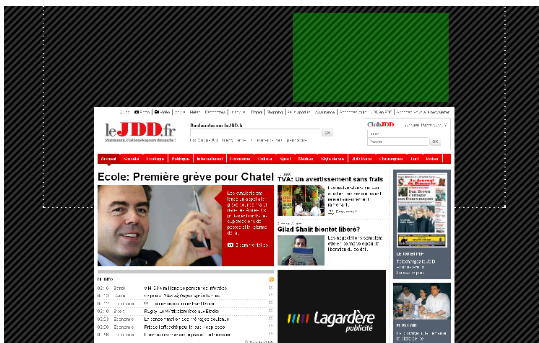
fig.1 - place de l'habillage